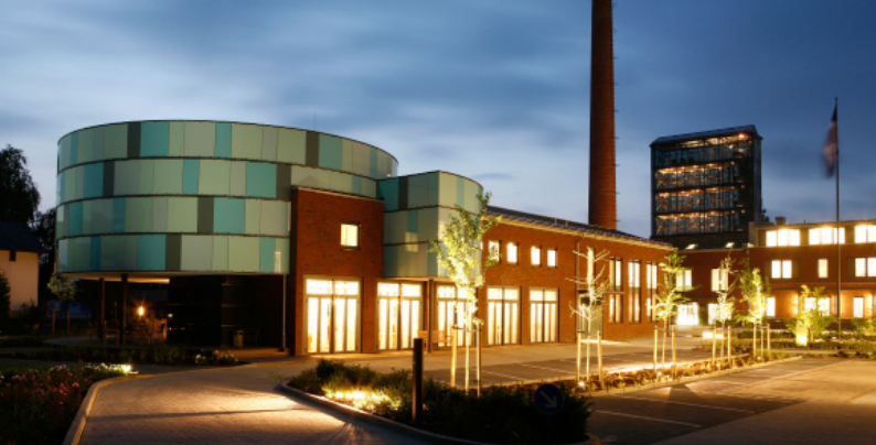
Nachtansicht der academy auf dem Gelände der NSB Reederei