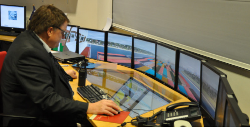
Instruktor im Regieraum des Schiffsführungssimulators